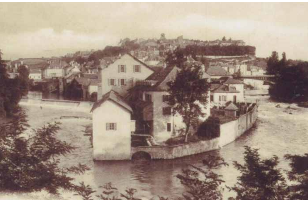
Confluent des deux gaves d'Aspe et d'Oloron Les Basses Pyrénées/ Centre Culturel et Patrimonial du Haut-Béarn

« LE PROJET DE PASCALE GUÉDOT BÉNÉFICIE D'UN DES SITES LES PLUS SPECTACULAIRES. LA VILLE D'OLORON-SAINTE-MARIE N'EST PAS BIEN GRANDE, 12 000 HABITANTS, MAIS LE PAYSAGE, FRACAS D'EAU ET DE ROCHES TOMBÉES DES PYRÉNÉES, LUI OFFRE UN CADRE IDÉALEMENT PROPORTIONNÉ. »