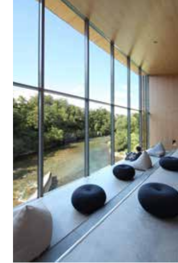
La proue de la médiathèque donnant sur le gave d'Oloron

Reprenant le modèle d'urbanisme oloronais en se situant à l'aplomb des gaves et épousant le socle de pierre, la médiathèque s'étire horizontalement, laissant le regard percevoir les berges et l'eau. Un belvédère forme un joint creux offrant une promenade spectaculaire facilitant l'accès à un lieu emblématique : la confluence des gaves. La façade principale de la médiathèque est entièrement vitrée, permettant de découvrir l'intérieur et incitant le visiteur à y entrer.