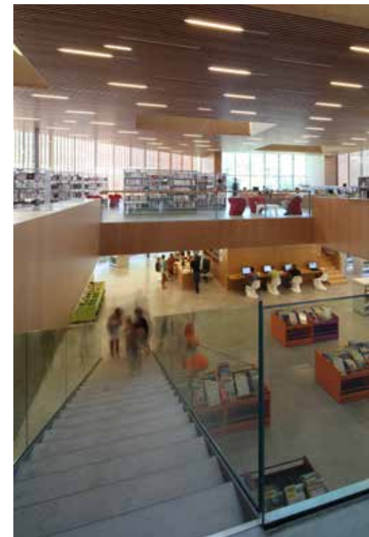
L'atrium desservant les espaces et les deux niveaux

La Médiathèque est un espace de découverte, de formation et de perfectionnement ouvert à tous les publics. C'est aussi un lieu de convivialité, de socialisation, d'apprentissage de la citoyenneté et de loisirs, de même qu'un centre de ressources pour la vie culturelle et éducative. Les 2 300m 2 d'espace dédié au public sont répartis sur deux niveaux réunis par un vaste hall et deux escaliers. Les bandes de bois verticales rythment la lumière et les vues vers l'extérieur du niveau supérieur. La Médiathèque des Gaves regroupe plusieurs sections (romans, mangas, BD, vidéo, musique, actualités...), propose de multiples actions culturelles et œuvre, avec le réseau de Lecture Publique, à la vie culturelle du Haut-Béarn pour le public de 0 à 100 ans.