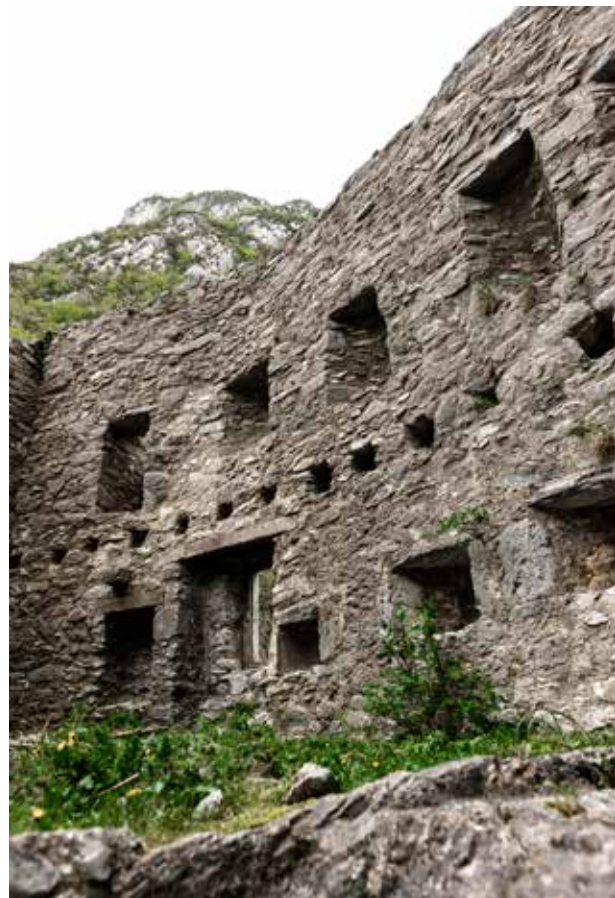
Le fortin du Poutou restauré

Un poste de péage existait depuis le 11 e siècle à Canfranc. A l'origine, le droit de passage était appliqué tous les sept ans. Lorsque le roi d'Aragon a décidé de le rendre annuel, le vicomte béarnais instaura le péage du Portalet. Les droits perçus en Béarn servaient à réparer murailles, chemins, rues et à payer la police des lieux.